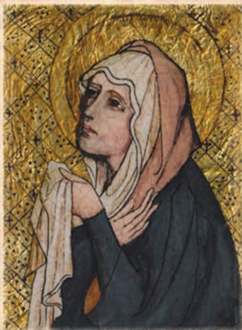
(Maria küsst Jesus im Volto Santo)

... Die Tränen, die aus Deinen Augen fliessen, scheinen mir zierliche Perlen zu sein, die ich liebend sammeln möchte, um mit ihrem unendlichen Wert die Seelen der Sünder auszulösen. O Jesus, Dein Angesicht ist die einzigartige Schönheit, die mein Herz umfängt, ich akzeptiere es, darin nicht die wahrhaftige Süßigkeit Deines Blicks zu sehen, nicht den unvergleichlichen Kuss des Mundes zu spüren, ... . Ich bitte Dich, in mir Deine Gottebenbildlichkeit einzuprägen, um in mir Deine Liebe entflammen zu lassen, damit sie mich schnell verzehre, und ich dadurch möglichst bald Dein glorreiches Angesicht im Himmel zu sehen vermöchte. Amen.