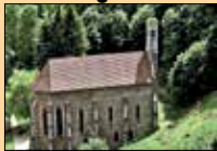
Marienkirche oder „Blutkirche“ aufbewahrt.